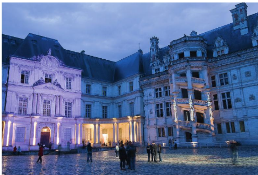
La cour du château de Blois pendant la Nuit européenne des musées en 2013

La Nuit européenne des musées est une manifestation qui existe depuis 2005 durant laquelle les musées européens ouvrent leurs portes, de manière exceptionnelle et généralement gratuite, le temps d'une soirée.