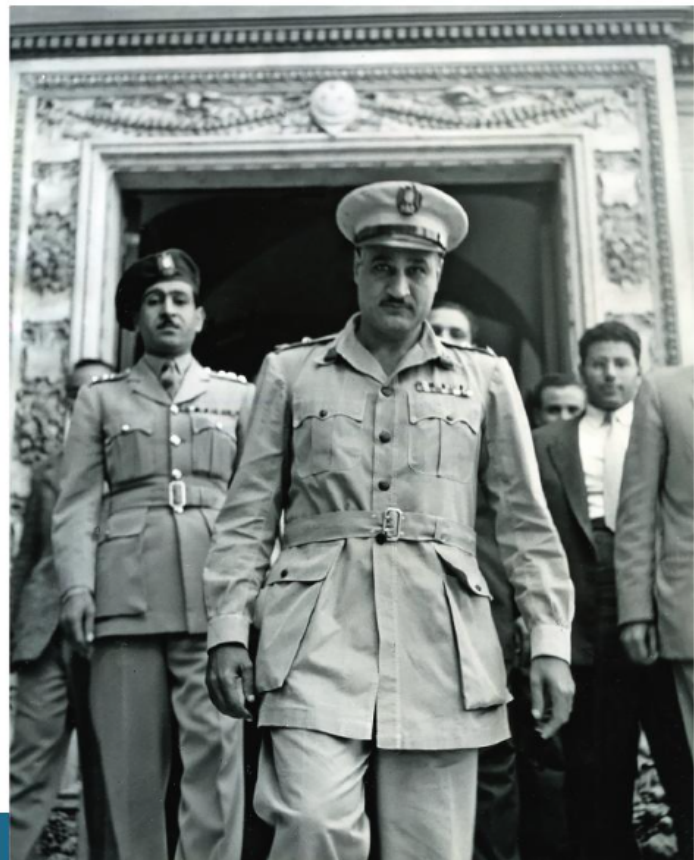
Gamal Abdel Nasser