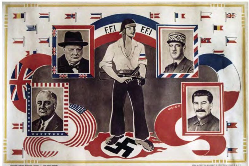
Document : Affiche de propagande des FFI 1 , 1944

Qui est à l'origine de l'unification des groupes de résistants intérieurs ? Quand a-t-elle eu lieu ?