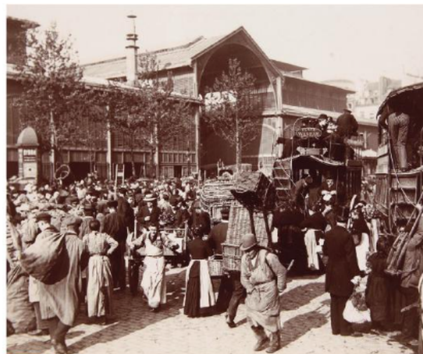
1 Les Halles de Paris (vers 1900)