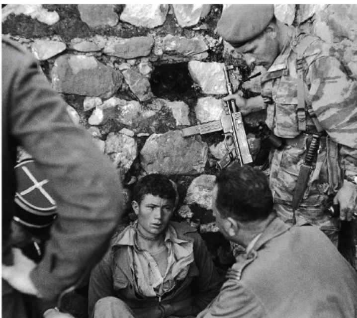
1 Interrogatoire d'un prisonnier par des soldats français (mars 1956.)

SUJET Le regard de la France sur la torture pendant la guerre d'Algérie, de 1962 à 2018