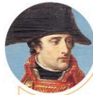
Napoléon Bonaparte (1769-1821)

Officier talentueux, il s'illustre lors des campagnes d'Italie et d'Égypte. Par le coup d'État du 18 Brumaire an VIII (8 novembre 1799), il renverse le Directoire et devient premier Consul. Populaire et à l'origine de nombreuses réformes, il se fait nommer consul à vie puis se proclame empereur sous le nom de Napoléon I er (1804). Établissant un régime de plus en plus autoritaire, il poursuit la guerre contre les pays européens et conquiert de nombreux territoires. Après la défaite de Waterloo en 1815, il abdique et est exilé dans l'île anglaise de Sainte-Hélène où il meurt.