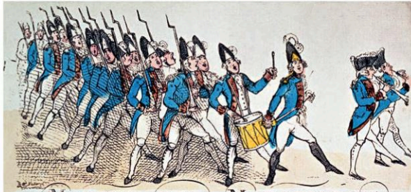
MARCHE DES MARSEILLOIS CHANTÉE SUR DIFFÉRENS THÉÂTRES Chez Frère Postage des Bateliers

🎵 La Révolution française est-elle une source d'inspiration durable ?