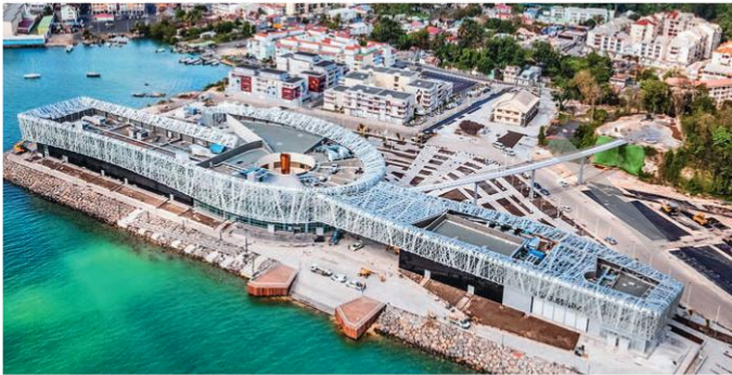
1 Le mémorial ACTE à Pointe-à-Pitre (Guadeloupe) inauguré le 10 mai 2015