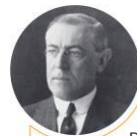
Woodrow Wilson (1856-1924)

Démocrate et pacifiste, il est élu président des États-Unis en 1912. Après avoir tenu son pays à l'écart du conflit, il veut créer un ordre international pacifique et durable. Il entre en guerre en avril 1917, devient un acteur majeur de la victoire puis des négociations. Mais le traité de Versailles qu'il a négocié est rejeté par le Congrès.