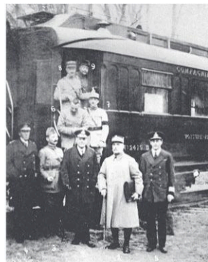
Photographie prise le 11 novembre 1918 à 7 h 30, au moment où le général Foch, porteur pour Paris, remet au gouvernement français le texte de l'Armistice qui vient d'être signé avec l'Allemagne.

Démocrate et pacifiste, il est élu président des États-Unis en 1912. Après avoir tenu son pays à l'écart du conflit, il veut créer un ordre international pacifique et durable. Il entre en guerre en avril 1917, devient un acteur majeur de la victoire puis des négociations. Mais le traité de Versailles qu'il a négocié est rejeté par le Congrès.