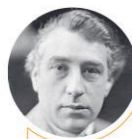
Abel Gance (1889-1981)

Le cinéma se développe au début du xx e siècle. Les autorités tentent d'utiliser cet art nouveau à des fins de propagande. En raison des contraintes techniques mais aussi des réticences des militaires, les opérateurs d'actualité comme les cinéastes n'ont pas accès aux zones de combat avant 1916. Ils ont recours aux reconstitutions. Certaines œuvres ambitieuses comme Cœurs du monde (1918) de l'Américain Griffith ou J'accuse (1919) d'Abel Gance tentent de rendre compte des combats tout en inventant un langage cinématographique.