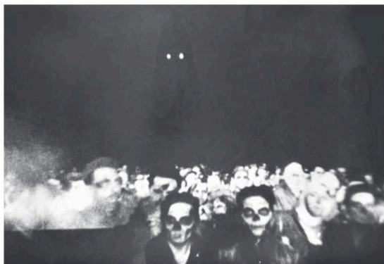
2 Le cortège des morts mettant en accusation les civils