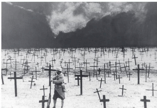
1 La représentation des morts sur le champ de bataille

Cinéaste français, qui commença à tourner ses premiers films en 1911, fut un précurseur, inventant sans cesse de nouvelles manières de filmer, fut à l'origine de grandes œuvres comme La Roue (1924), Napoléon (1931). J'accuse , film muet, a été tourné en 1917, diffusé en 1919.