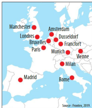
1 Les aéroports internationaux où Frontex exerce des contrôles