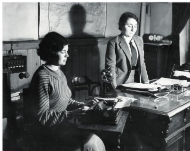
1 Un bureau de police à Istanbul

Une officière de police et sa secrétaire à Istanbul, 1934.