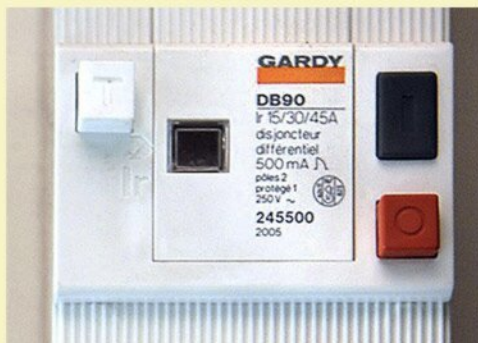
► Disjoncteur général

► Puissance et tension nominales de quelques appareils électriques