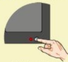
Appareil en veille