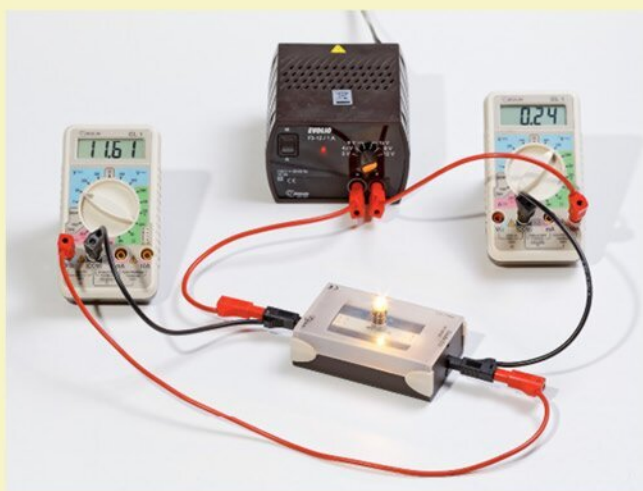
► Mesure de la puissance électrique d'une lampe